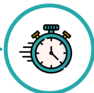
Proceduri adaptate pentru a reduce timpul de expunere