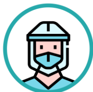
Complet echipat cu PPE