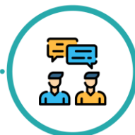
Îngrijire medicală ajustată discutată cu dumneavoastră

Dacă vă îmbolnăviți de COVID-19 după operație, echipa medicală a spitalului va lua în considerare riscul dumneavoastră crescut datorat intervenției chirurgicale recente și vă va oferi îngrijiri medicale pentru a asigura recuperarea dumneavoastră atât din punct de vedere chirurgical, cât și infecțios.