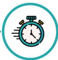
Procedimentos adaptados para reduzir o tempo de exposição