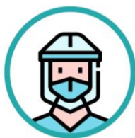
Equipamentos de proteção individual