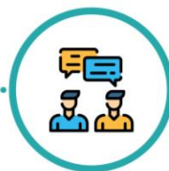
Modifiche delle cure discusse con il paziente

Se dovessi sviluppare la malattia da coronavirus (COVID-19) dopo l'intervento, il team ospedaliero prenderà in considerazione i rischi aumentati dovuti al recente intervento chirurgico e fornirà un trattamento di supporto per promuovere il recupero sia dall'intervento che da qualsiasi infezione.